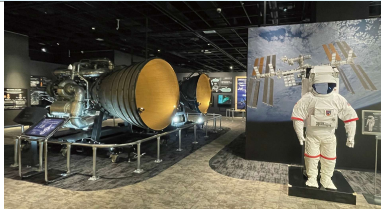
▲展示コーナーには、ほかにも、海ゾーン、陸ゾーン、シアターなどがある。

三菱重工グループのものづくりや最先端の科学技術を紹介するミュージアム。迫力あるロケットエンジンの実物展示、タッチパネルなどの体験展示などがあり、深海から宇宙まで様々な展示で楽しく学ぶことができる。日常生活で触れる機会の少ない科学技術を知ろう！