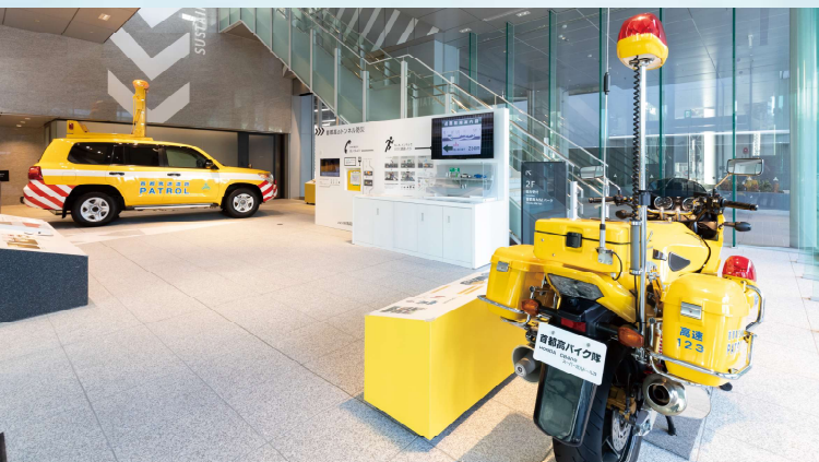
「安全・安心」を守り続ける首都高パトロールバイク&パトロールカー▲