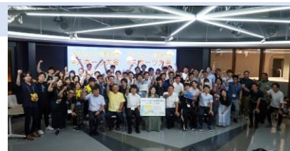
前回大会の様子 (60団体 100名参加)