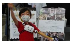
ゆる～く楽しむ、音楽体験 「YURU MUSIC」