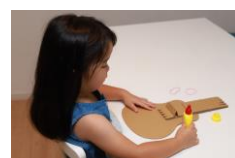
つくろう！ならそう！ 楽器作り体験