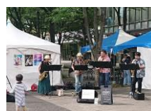
「みなとみらい STREET MUSIC」