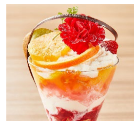
「カーネーションパフェ」

https://www.tokyuhotels.co.jp/yokohama-r/information/64374/index.html