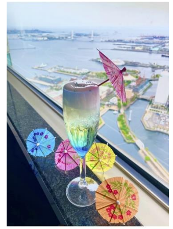
限定ドリンク「空庭慈雨（くうていじう）」

『新・雨の日キャンペーン』、『新・視界ゼロキャンペーン』は、通常大人入場料金1,000円でご入場いただき、オリジナルポストカード1枚と、ドリンク1杯がもらえるお得なキャンペーンです。ドリンクは、生ビール、ハイボール、レモンサワー、ソフトドリンク、そして今回新登場のキャンペーン開催時のみご提供するオリジナル限定ドリンク「空庭慈雨（くうていじう）」の中から、好きなドリンクをお選びいただけます。当日、併設のスカイカフェにてドリンク引換券をお渡しいただき、好きなドリンクをお召し上がり下さい。