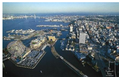
Yokohama Bay City