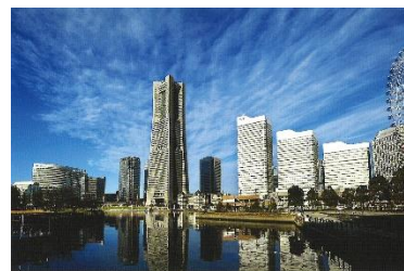
YOKOHAMA Minato Mirai 21