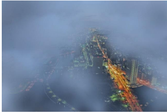
雨天時、眼下に雲を望むスカイガーデンからの景色（一例）