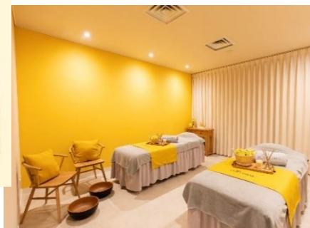
トリートメントルーム「イモータル」