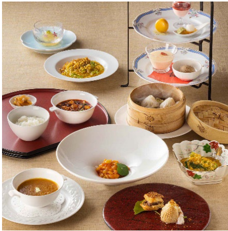
ランチコース イメージ