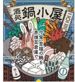
<イベントキービジュアル>