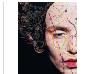
福井利佐《幽玄美 of 能「化身」》（部分）

make-up: UDA [mekashi project]