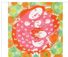
柳沢京子《キュー、して。「母子像より」》2021年