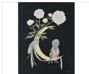
筑紫ゆうな《無題》2021年