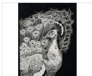
切り剣Masayo《昂然（孔雀）》2019年

make-up: UDA [mekashi project]