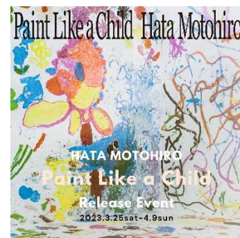
秦 基博さんコラボイベント ビジュアル