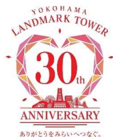
横浜ランドマークタワー 周年記念ロゴ

「ありがとうをみらいへつなぐ。」をテーマとした、みなとみらいエリアの周年をお祝いする記念ロゴ。三菱地所グループの「三角形」をモチーフとしたハートマークは、今まで施設にお越しいただいたお客様への感謝の気持ちを表現しています。華やかさと親しみやすさを兼ね備えたデザインを基調としながら、みなとみらいエリアの洗練された街並みと、アニバーサリーイヤーを迎える三菱地所グループの施設をシルエットで表しています。