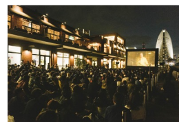
THEATER MARINE & WALK過去開催風景