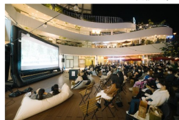
THEATER BAY QUARTER過去開催風景