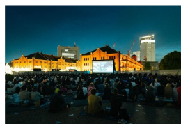
THEATER RED BRICK過去開催風景