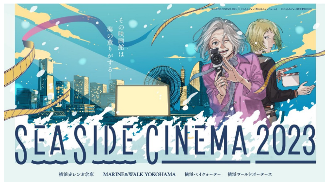
横浜赤レンガ倉庫 MARINE&WALK YOKOHAMA 横浜ベイクォーター 横浜ワールドポーターズ

SEASIDE CINEMA 2023実行委員会は、横浜赤レンガ倉庫・MARINE & WALK YOKOHAMA・横浜ベイクォーター・横浜ワールドポーターズの4つの会場で、それぞれのテーマに沿った様々な映画体験が楽しめる日本最大級の野外シアターイベント「SEASIDE CINEMA 2023（シーサイドシネマ）」を2023年5月2日(火)～7日(日)に開催します。この度、各会場の上映作品が決定したので発表します。