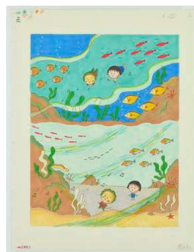
『ももこのファンタジック・ワールド コジ コジ』海のおじいさんのおんがくの巻 1993年 ソニー・マガジンス ©さくらも もこ ©さくらプロダクション

本展の取材・掲載に関わる写真資料等の貸し出しにつきましては、下記までご連絡ください。