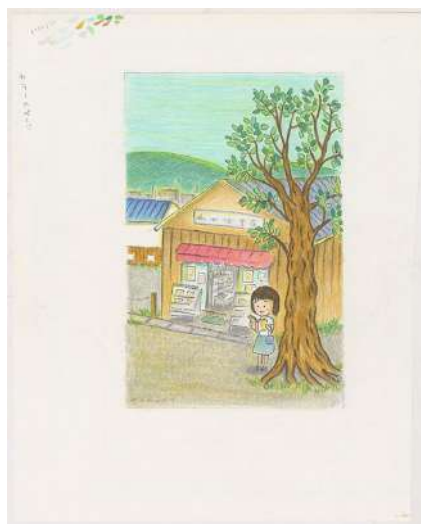
『ひとりずもう』総扉絵 ©さくらももこ