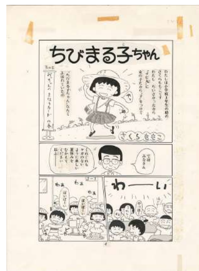
『ちびまる子ちゃん』その1 おっちゃん のまほうカードの巻(1) ©さくらプロダクション