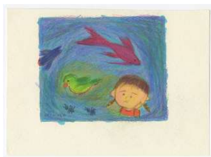
『ももこのいきもの図鑑』最終回 ©さくらももこ