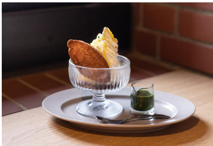
<コラボメニューイメージ>

本企画は、当館が中心となって、そこに集う様々な人びとと“+α”を生み出すプロジェクト『RedBrick Hub』の施策の一つとして、「横浜赤レンガ倉庫」に店舗を構える「ありあけ」と「UNI COFFEE ROASTERY」のコラボレーションが実現。今春に実施した第1弾では、当館限定の特別メニュー『ハーバーアフオガート』を2023年3月から販売し、2か月間で1,500食超を提供するなど多くの反響をいただきました。この度、ご好評につき、第2弾特別コラボメニューとして『ゆずハーバーアフオガート』を販売することとなりました。