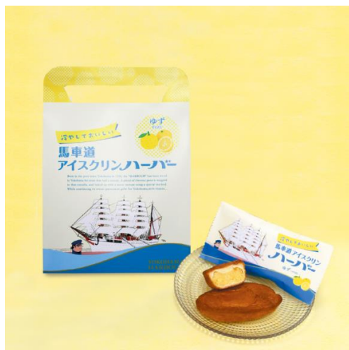
<『馬車道アイスクリンハーバー ゆず』イメージ>