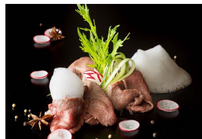
「国産牛の冷製しゃぶしゃぶ 泡のソース」 (土日祝のみ)イメージ

カリフォルニアシーザーサラダ スチームチキン添え ハワイアングルメ“アヒポケ”トスカスタイルで メキシカン“タコス”セルフスタイル パパイヤと海老のカクテル スイカとトマトのガスパチョ ほか