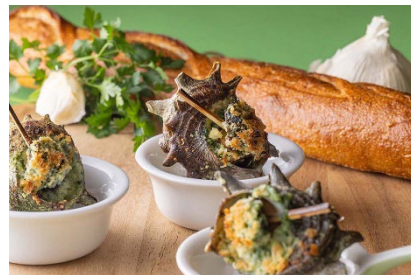
「姫サザエの旨煮 香ばしガーリック」イメージ

姫サザエの旨煮 香ばしガーリック 国産牛の冷製しゃぶしゃぶ 泡のソース (土日祝のみ)