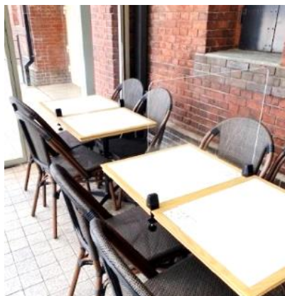
<パーテーション設置中の様子>