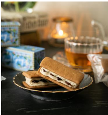
<Huffnagel バターサンド EARL GREY イメージ>

本企画は、当館が中心となって、そこに集う様々な人びとと“+α”を生み出すプロジェクト『RedBrick Hub』の第三弾として実現。2023年春の第一弾、夏の第二弾には、同じく横浜赤レンガ倉庫に店舗を構える「ありあけ」「UNI COFFEE ROASTERY」の2店舗がコラボした特別メニューを販売し、多くの反響をいただきました。