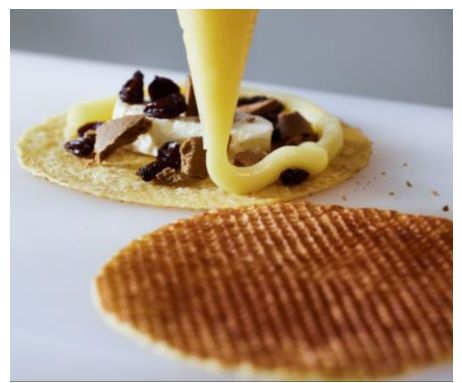
<コラボメニュー 調理イメージ>