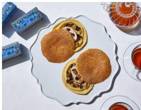
<コラボメニューイメージ>