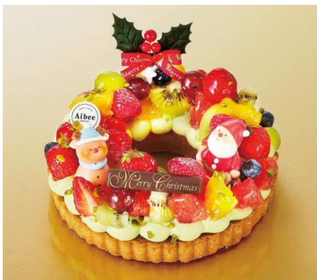
アイビー タルトレット バイ スイーツワゴン X'mas リースタルト