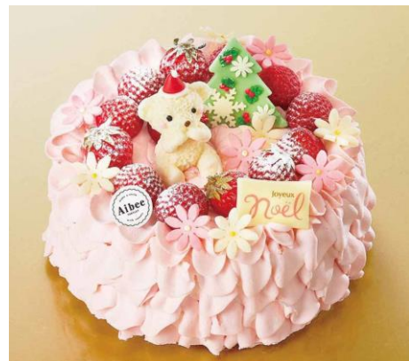
アイビー タルトレット バイ スイーツワゴン ホワイトベア クリスマス