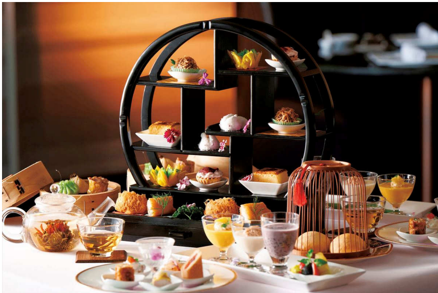
「天空のチャイニーズアフタヌーンティー “夕映えの幻想と香味甜品”」 ※画像は2名様分です