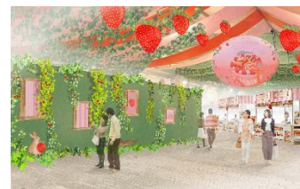
※会場装飾イメージ

今年の装飾テーマは“Strawberry Forest いちごの森”。森の中をイメージした空間で、いちごを思いっきり楽しんでいただきたいとの思いで、いちごづくしの可愛い、夢のような世界が広がります。