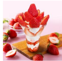
<Rin Rin> 贅沢あまりんパフェ

米粉で作り、米油で揚げた、約40cmの長さを誇る米粉チロス。本イベント限定で、国産苺を使用した苺ドライをまぶしました。カリッ、サクッ、モチッとした食感と香ばしい甘さが特徴で、注文を受けてから一つ一つ調理し、揚げたてを提供します。