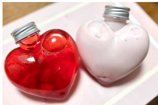
<しなこ&ダガネの ストロベリーファクトリー> しなこ&ダガネ♡ ソーダストロベリー ／ミルクストロベリー

しなこ、ダガネのハートフルなカップのオリジナルドリンク。オリジナルタグ付きで販売します。