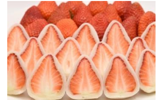
<ストロベリー> 全国のいちご8種類の いちご大福

大阪で大人気のカフェが本イベントに初出店！とろけるクリーム、じゅわっと甘酸っぱいティラミスに3種類のいちごを合わせた「食べ比べいちごティラミス」を作りました。いちごの香りと酸味の違いをぜひお楽しみ下さい。