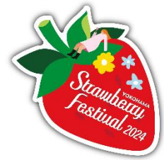
※ステッカーデザインイメージ

MARINE & WALK YOKOHAMA や横浜ハンマーヘッド、横浜ワールドポーターズの3つの近隣商業施設でもストロベリーフェスティバルを開催！施設ごとにこの時期だけのいちごメニューなどを展開します。この他、横浜みなとみらい地区の商業施設・ホテル等でもいちごフェアが実施されるなど、エリア一帯がいちご色に染まります。