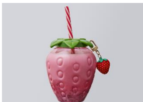
<STRAWBERRY HOUSES> 数量限定！あまおうの Premiumいちごミルク

ドイツ大使館公邸シェフ・小林氏監修、やよいひめを使用したモンブラン！王道のモンブランに負けない甘みと酸味が特徴の一品です。