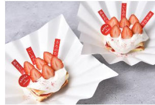
<ROCCA&FRIENDS> 食べ比べいちごの とろけるティラミス

いちご飴に最適な、酸味を抑え甘さが際立つのが特徴の『とちあいか』を使用した専門店のいちご飴。賞味期限30分の出来たていちご飴をご提供します。最初のひと口がカリッとし、中のいちご果汁がジュワッと広がるこだわりのいちご飴。