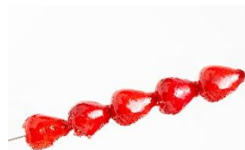
<Strawberry Moon> 数量限定！ 賞味期限 30分！ とちあいかのいちご飴

1杯1杯、丁寧に手作したいちごミルク。フレッシュあまおうを贅沢に使用し、濃厚牛乳といちごジュレをブレンドした果肉感たっぷりのいちごミルク。いちごのキーホルダー付きのかわいい限定ボトルに入れて販売します。