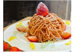
<苺の生搾り モンブランカフェ> 苺の生搾りモンブラン

埼玉県オリジナルブランド苺『あまりん』を贅沢に使用したパフェ。一番上には特選級の大粒あまりんを贅沢にトッピングしました。