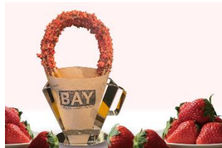
<米粉チロス専門店 BAY> ベリーチョコランチチロス

しなこ、ダガネのハートフルなカップのオリジナルドリンク。オリジナルタグ付きで販売します。