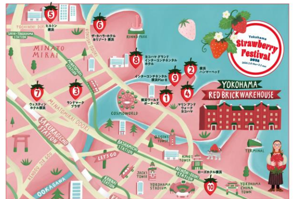
みなとみらい いちご巡りマップ イメージ

さらに、本イベントの開催期間中は、横浜・みなとみらいエリアを中心とした近隣の商業施設・ラグジュアリーホテル等でも様々な“いちごメニュー”を展開し、イベントを通じてエリア一帯がいちご色に染まる『みなとみらい いちご巡り』企画を実施。手軽にテイクアウトできるメニューや、人気店の限定メニュー、ホテルのスイーツbuffet等、様々な形でいちごを思う存分お楽しみいただけます。