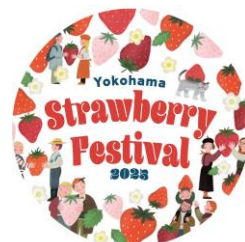
イベントオリジナルステッカー イメージ

※ランドマークプラザと横浜赤レンガ倉庫は、2月18日(火)休館日となります ※詳細は、特設サイトをご確認ください