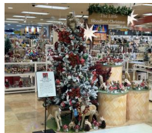
〈イベント会場 イメージ〉