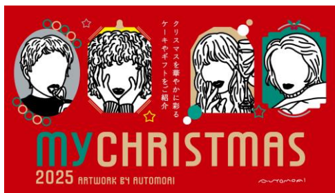
〈キービジュアル一例〉