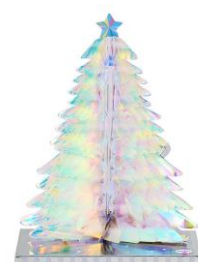
©'25 SANRIO CO., LTD. APPR. NO. C661007