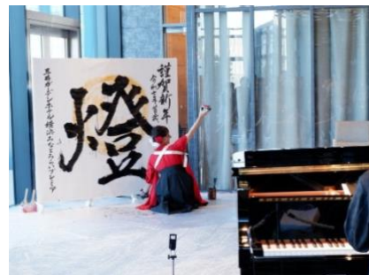
書道パフォーマンス（20階サロン）