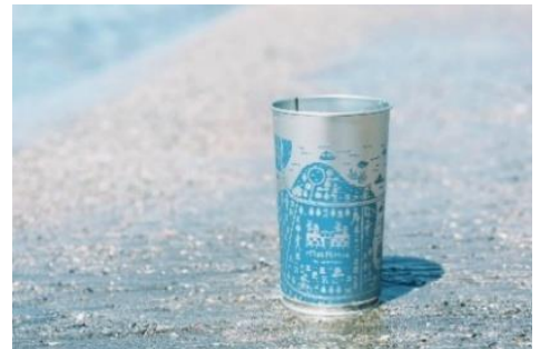
スチールカップ「MARK IS カップ」

https://www.mec-markis.jp/mm/statics/goodproject/good202510/good1.html