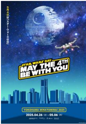
TM & © Lucasfilm Ltd. All Rights Reserved

ゴールデンウィークの「STAR WARS DAY YOKOHAMA MINATOMIRAI 2025」や、夏休みの「ランドマークプラザ・マークイズみなとみらい 恐竜祭り」、「SPY×FAMILY『おでかけ』大作戦 in 横浜・みなとみらい」など、近隣施設との合同施策を通じてエリア全体の賑わいを創出。クリスマスからニューイヤーシーズンには「トムとジェリー」とコラボレーションした「YOKOHAMA MINATOMIRAI WINTER HOLIDAY 2025-2026 -トムとジェリー となりに、キミがいる。-」を展開し、施設集客を獲得しました。今後も横浜市や近隣集客施設であるぴあアリーナMM、Kアリーナ横浜などの連携も強化し、魅力ある街づくりへの貢献を目指します。