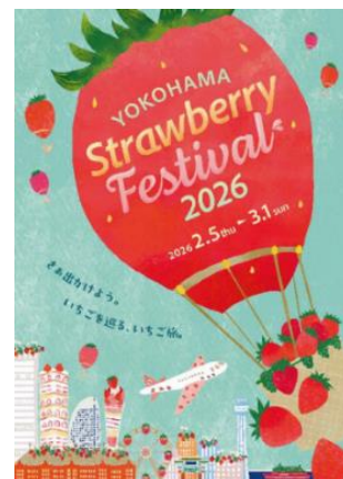
「Yokohama Strawberry Festival 2026」 キービジュアル

※「Yokohama Strawberry Festival 2026」イベント特設サイト https://www.yokohama-akarenga.jp/strawberryyfes/