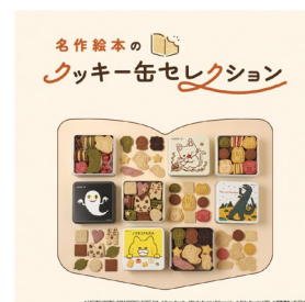
クッキー缶 商品イメージ

中に入っているクッキーは「小麦・卵・乳」不使用で、原材料にもこだわっています。小さなお子さまに寄り添った商品を目指して、保存料、香料、着色料も使用していません。幅広い世代に人気の絵本とのコラボのため、ご家族の皆さんでお楽しみいただくことができるほか、ギフトにも最適です。また、何気ない日常に幸せを運ぶまるでショートケーキのようなお菓子「Bake shortcake」も販売。いちごショートケーキのスポンジと生クリームといちごをイメージしたクッキーサンドです。