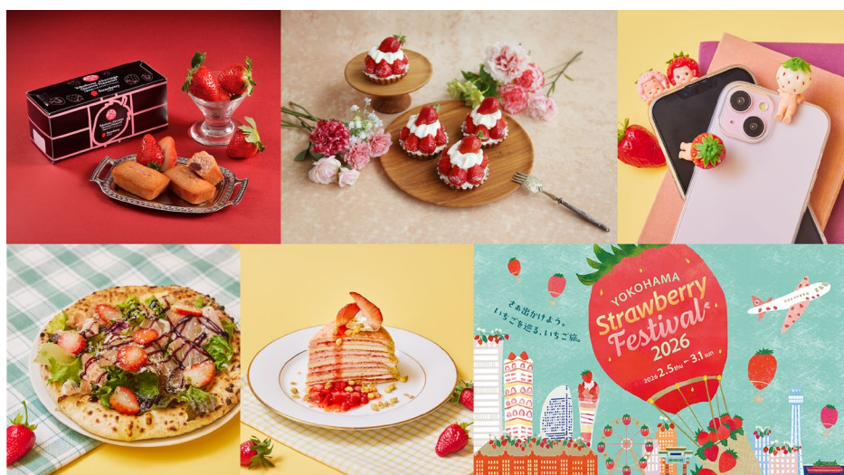
<横浜赤レンガ倉庫 いちごスイーツ・グルメ・物販 イベントイメージ>

横浜赤レンガ倉庫では、1 号館・2 号館の飲食・物販店舗にて、旬のいちごを使った限定スイーツやグルメのほか、お土産や関連グッズなどが登場いたします。