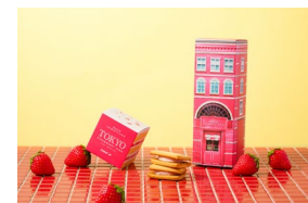
Bake shortcake 商品イメージ