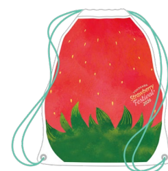
ノベルティイメージ