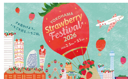
イベントキービジュアル

今年はイベントテーマを「いちごトリップ」と題し、日本各地から集まるご当地いちごを通じて、地域の魅力に触れたり、いちごスイーツやグッズにときめき癒されたり、いちごをきっかけに横浜エリアを散策したりと、様々ないちごをめぐる“いちごの旅”をお楽しみいただけます。最新から定番まで、食べきれないほどのバリエーション豊かないちごスイーツを存分にお楽しみください。