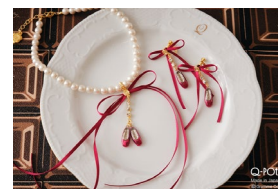
赤い靴 アクセサリー商品イメージ

横浜を舞台にした童謡「あかいくつ」からインスパイアされた“赤い靴”Collectionが登場。その他、甘酸っぱい魅力が詰まった Q-pot. 2026 Valentine 新作アクセサリや、Q-pot CAFE.のスイーツやグッズなど、バレンタインにぴったりのアイテムが並びます。ぜひこの機会に足を運んでみてはいかがでしょうか。