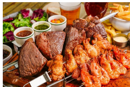
<食べ放題メニュー イメージ>