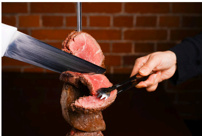
<シラスコカットシーン イメージ>

横浜赤レンガ倉庫は、2026年4月1日（水）より『BUTCHER REPUBLIC 横浜赤レンガ シラスコ BBQ & BEER』 （運営会社：EVER BREW 株式会社）がリニューアルオープンすることをお知らせいたします。