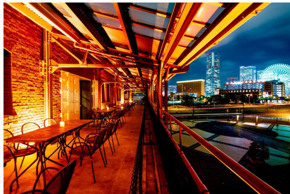
<バルコニーイメージ>