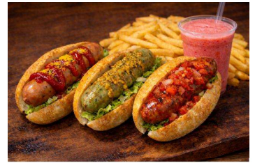
ファミリー向けメニュー イメージ

小さなお子様連れのご家族にもイベントを存分に楽しんでいただきたいという想いから、グリルソーセージ3種類を使用した食べやすいサイズの「プティグルメドッグと選べるスムージー」など、親子で一緒にお食事を楽しめるメニューもご用意しました。