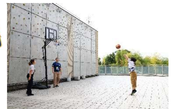
シュートゲーム イメージ