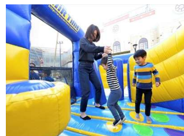
ふわふわ イメージ