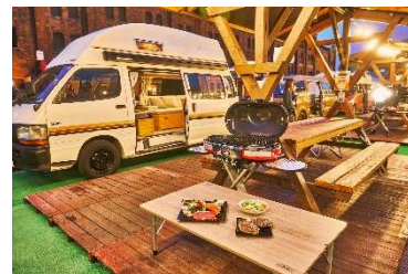
デイキャンプ イメージ

歴史的建造物でもある横浜赤レンガ倉庫とみなとみらいの海を臨めるロケーションで“デイキャンプ”をお楽しみいただけます。BBQやキャンピングカーに加え、アウトドア用品ブランド「コールマン」の本格的なアウトドアグッズでつくる“キャンプ飯”を味わっていただけます。今年はエリア区画数を昨年の8区画から10区画へ拡大し、より多くの方にお楽しみいただける空間となっています。