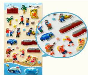
ノベルティ イメージ