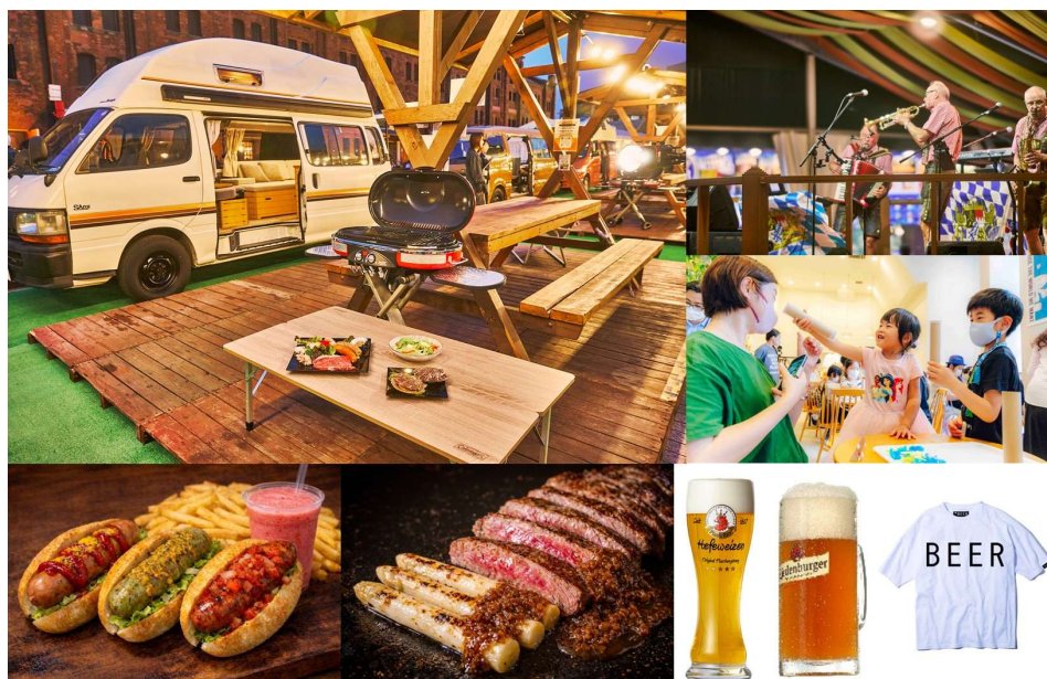
『ヨコハマフリューリングスフェスト 2026』コンテンツ・展開メニュー イメージ

横浜赤レンガ倉庫では、2026年4月24日（金）から5月10日（日）の計17日間、横浜赤レンガ倉庫イベント広場・赤レンガパークにて『ヨコハマフリューリングスフェスト 2026』を開催します。