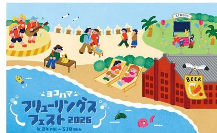
イベントキービジュアル