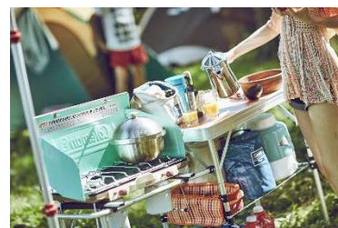
コールマングッズ イメージ