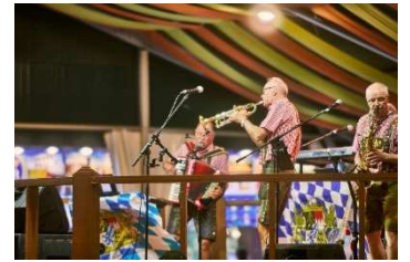
ドイツ楽団 演奏の様子