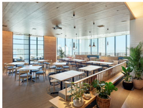
大きな窓からハーバービューを望むレストラン