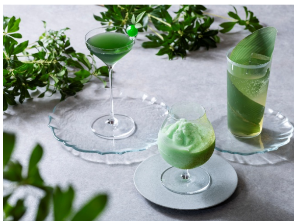
※写真右から スプリング ヴェール、 抹茶ショコラマティーニ、翠風(すいふう・ノンアルコール)