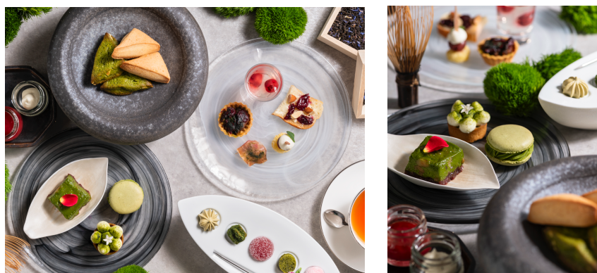
抹茶とチェリーを満喫できる「抹茶とチェリーのアフタヌーンティー」

※季節のアフタヌーンティーは、同フロアの「BAR BELLO GATTI(バー ベッロ ガッティ)」でも同内容にて提供しております。