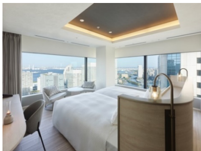
客室エグゼクティブコーナーツイン(46.1㎡)