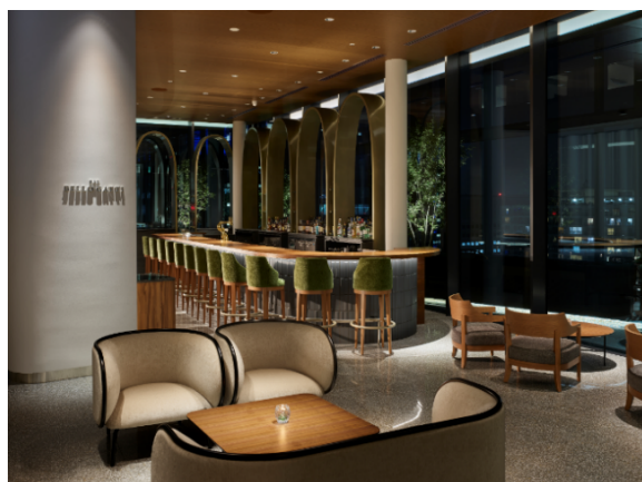
20階 BAR BELLO GATTI(バー ベッロ ガッティ)