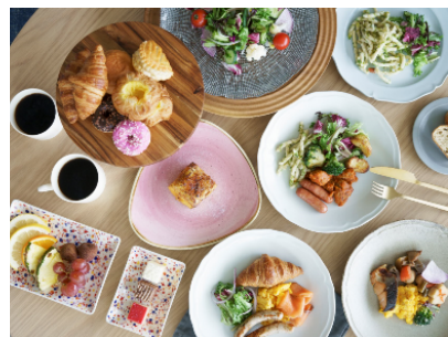
朝食(フレンチトーストは ライブキッチンで出来立てを提供)