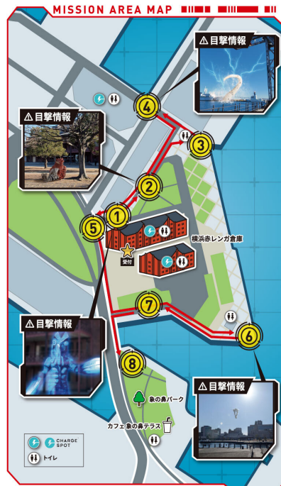
※画像はイメージです。実際のプレイ画面とは異なる場合があります。