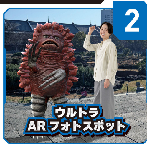
※画像はイメージです。実際のプレイ画面とは異なる場合があります。