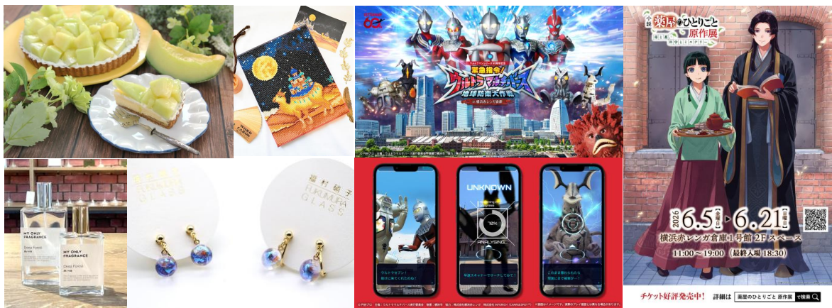
<横浜赤レンガ倉庫 グッズ・メニュー イベントイメージ>

横浜赤レンガ倉庫では、1号館・2号館内の飲食・物販店舗にて、5月～6月の梅雨時期に向けて揃えたいレイングッズやアイテム、気分を上げてくれるアクセサリーのほか、旬の果物をつかったスイーツ、雨の日でも館内やご自宅で楽しめる体験コンテンツなどを展開いたします。