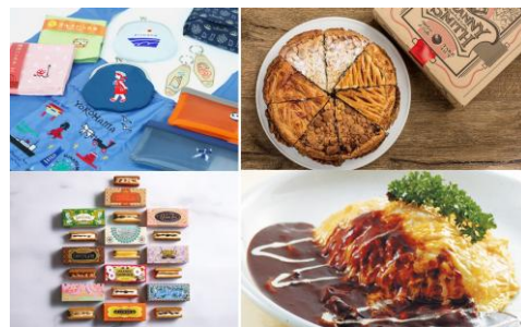
<対象店舗商品 一例>

ご来館当日に雨が降っている場合に限り、横浜赤レンガ倉庫2号館1階インフォメーションにて館内の対象店舗（約45店舗）にて店舗ごとの“お得な”サービスが受けられるクーポンをプレゼント。詳細は、以下に記載しているキャンペーン概要欄をご確認ください。